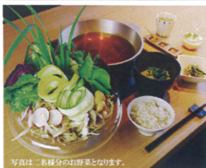
写真は二名様分のお野菜となります。