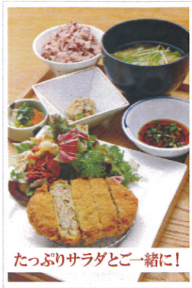
たっぷりサラダとご一緒に!

おろしポン酢でさっぱりと 『キャベツメンチカツ』定食 (キャベツメンチカツ・紫黒米入りご飯・お野菜汁・小鉢・お新香)