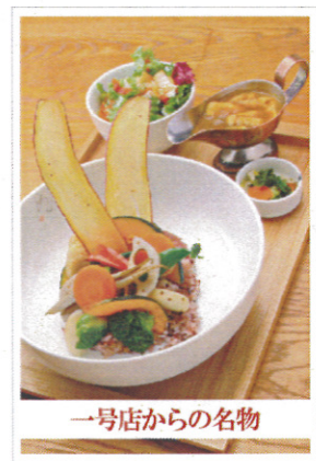
一号店からの名物