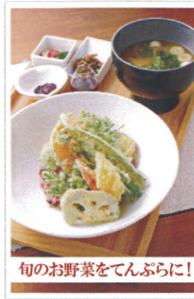
旬のお野菜をてんぷらに!